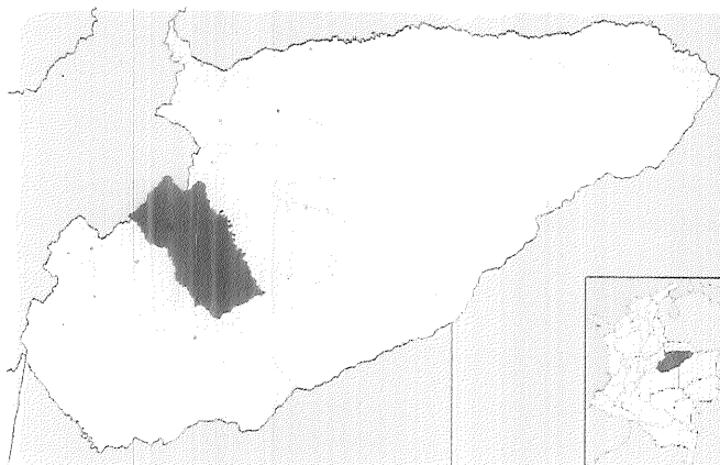
Imagen No.3 Municipio de Yopal